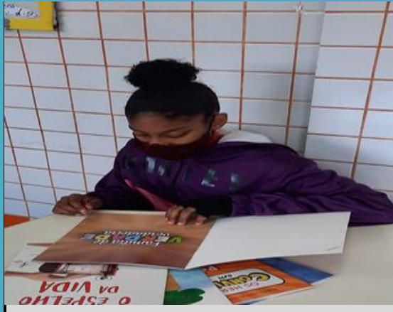
Livro da Paulus

Leitura Coletiva do livro "De verdade Verdadeira"