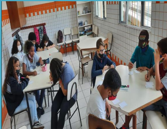
Mãos A Obra